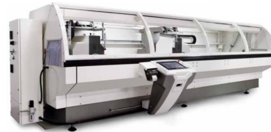
Tronçonneuse double têtes avec protection