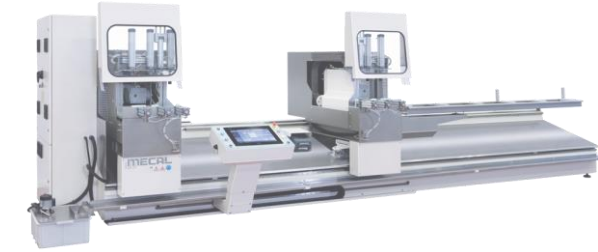
Tronçonneuse double têtes acier