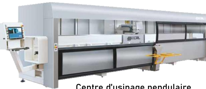
Centre d'usinage pendulaire