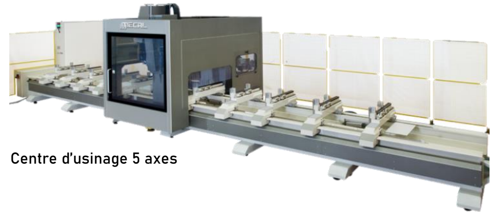
Centre d'usinage 5 axes