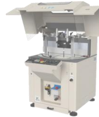
Tronçonneuse simple tête