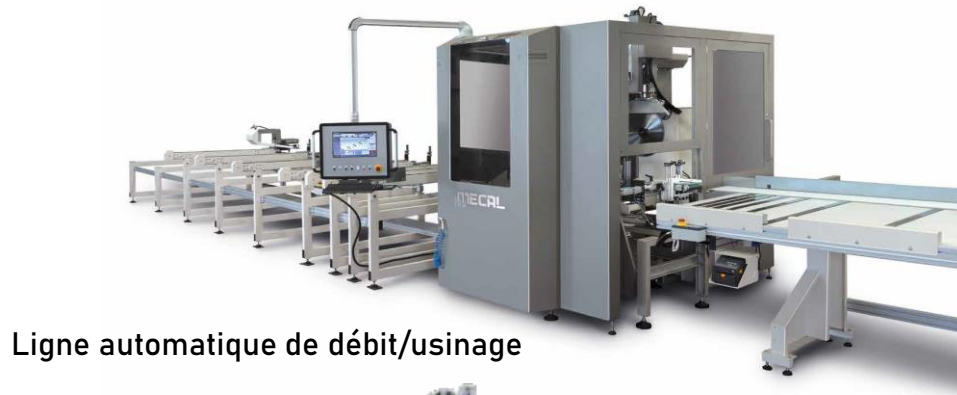
Ligne automatique de débit/usinage