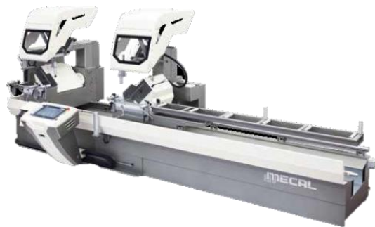
Tronçonneuse double têtes