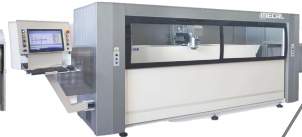
Centre d'usinage 3 ou 4 axes