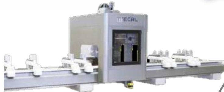
Centre d'usinage 5 axes