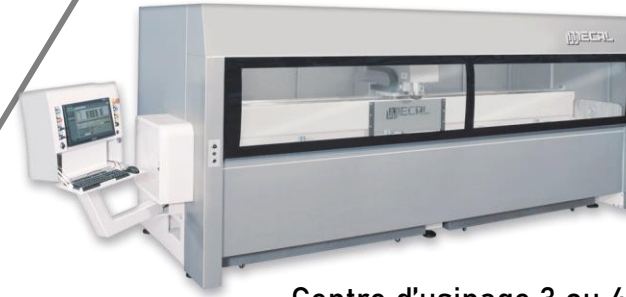
Centre d'usinage 3 ou 4 axes acier